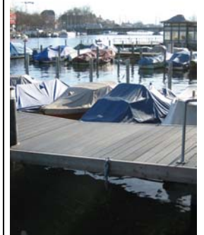
Schräger Übergang zum Ufer