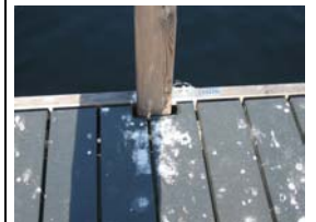
Ausschnitt für Geländerpfosten

Bachmattstrasse 53 CH-8048 Zürich TEL +41 44 436 86 86 FAX +41 44 436 86 87 info@swissfiber.com