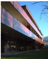
Loftwohnungen Mühlebündt, Dornbirn