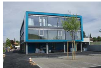
Geschäftshaus Worbstrasse, Muri bei Bern