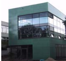
Friedrich Wöhler Gymnasium, Singen