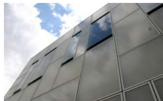
Fraunhofer Institut Ilmenau