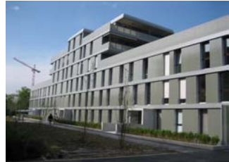
Loftwohnungen Hegifeld, Winterthur