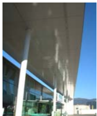
Merkur Markt, Dornbirn