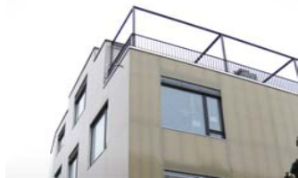
Eigentumswohnungen, Buchmattweg 5, Zürich