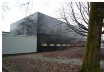
Turnhalle Kantonsschule Wohlen