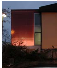
Gasthof von Arx, Egerkingen