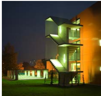
Oberschule Eichi, Niederglatt