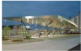
Busbahnhof Flughafen Zürich