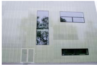
Spiel- und Sporthalle Hard