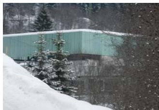
Talstation der Bergbahnen in Vals