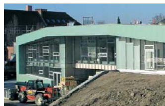
Ordrup Hallen, Kopenhagen