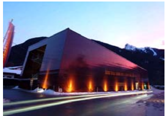
Talstation der Zammangbahnen, Schruns