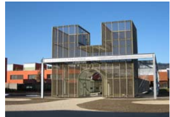
Via Praetoria, Windisch