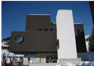
Talstation Bergbahnen Disentis