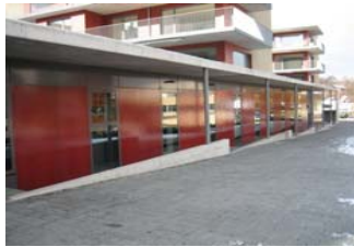
Einkaufszentrum Gossau ZH