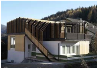
Esker Haus, Innichen