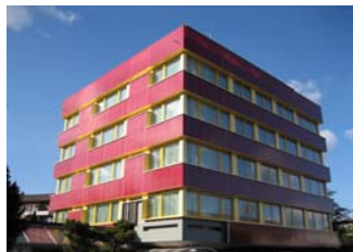
Airport Hotel, Glattbrugg

Diethelm Fassadenbau AG, Hermetschwil-Staffeln