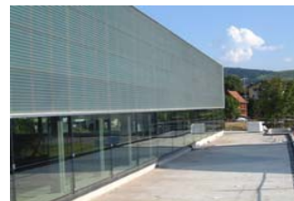
Turnhalle und Schulhaus Menzingen